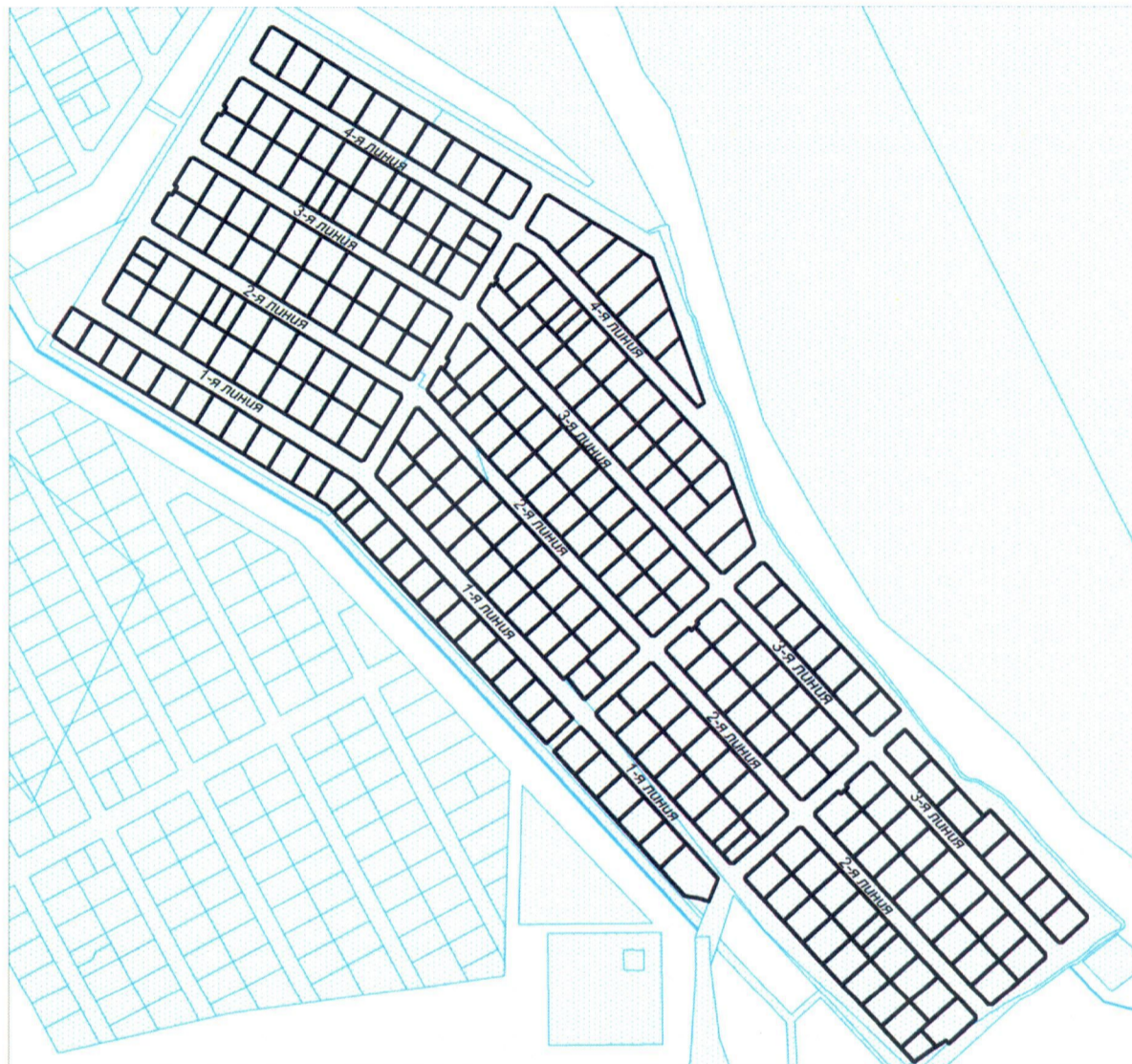
Схема расположения элемента улично-дорожной сети